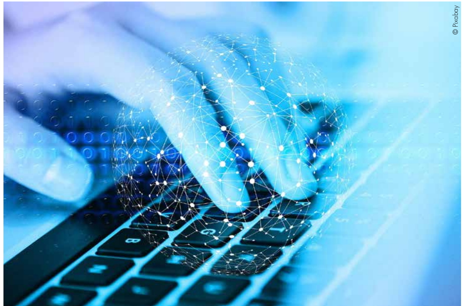
CEUP 2030-Abschlusskonferenz: Industrie 4.0-Zukunftstechnologien für CEE.

Im produzierenden Bereich wird der Einsatz von KI schon erprobt – auch wissenschaftliche Institutionen beschäftigen sich damit, die Politik fördert mit Maßnahmen und Instrumenten. Im Rahmen eines Policy Learning Labs von CEUP 2030 wurden Politikinstrumente und Best Practices ausgetauscht,