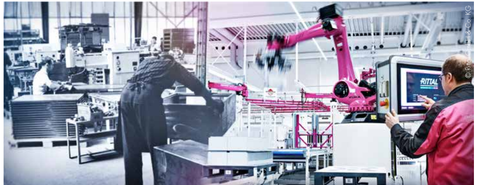
Vom Blechbearbeiter zum internationalen Digitalunternehmen – in 60 Jahren.

Parallel investierte Rittal Mitte der 80er in ein kleines Unternehmen mit zwei Mitarbeitern und baute Eplan auf – zu einem Zeitpunkt, als kaum jemand an Softwarelösungen für Schaltschranktechnik dachte. Über die nächsten Jahre und Jahrzehnte entstand ein breites Spektrum an Software und Services rund um das Engineering. Heute ist das Schwesterunternehmen von Rittal weltweit einer der führenden Software-Anbieter