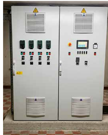
Bild li.: Gebäudefunkanlage in 19"-Technik Bild re.: Pumpwerk Magistrat Klagenfurt, Völkermarkter Straße

Seit 2005 ist RCOM System Alliance Integrator der Firma Schneider Electric Austria. Als Alliance Partner von Schneider Electric entwickelt RCOM kundenspezifische Systemlösungen in den Kernbereichen Wasser und Abwasser sowie Industrie und ist spezialisiert auf die Modicon M340 und M580 SPS-Steuerungen von Schneider Electric. RCOM ist der Spezialist für Migrationen und Umbauten, da RCOM auch alte bestehende Steuerungen, die teilweise noch unter MS-DOS oder OS2 programmiert wurden, programmieren, servicieren, konvertieren und in neue Systeme einbinden kann.